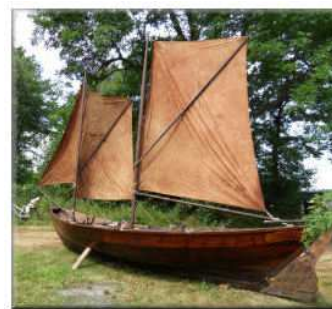
Skötbåten Emvika från Rådmansö